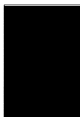
200 x 300 cm