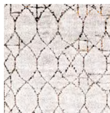
LG | LB