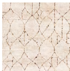
CR | LB